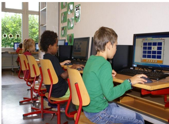
in der 1. Klasse beim Memory

Auch mit den Kindern kann nun an den PCs der Unterricht ergänzt, erweitert und bereichert werden. In vielen Lehrmitteln werden CDs zur Ergänzung des Unterrichts mitgeliefert. Auch das Internet bietet zahlreiche Möglichkeiten, die Lernenden zu unterstützen. Ebenfalls gibt es verschiedene Lernsoftware, um den Kindern den Stoff auf unterschiedlichste Weise zu vermitteln.