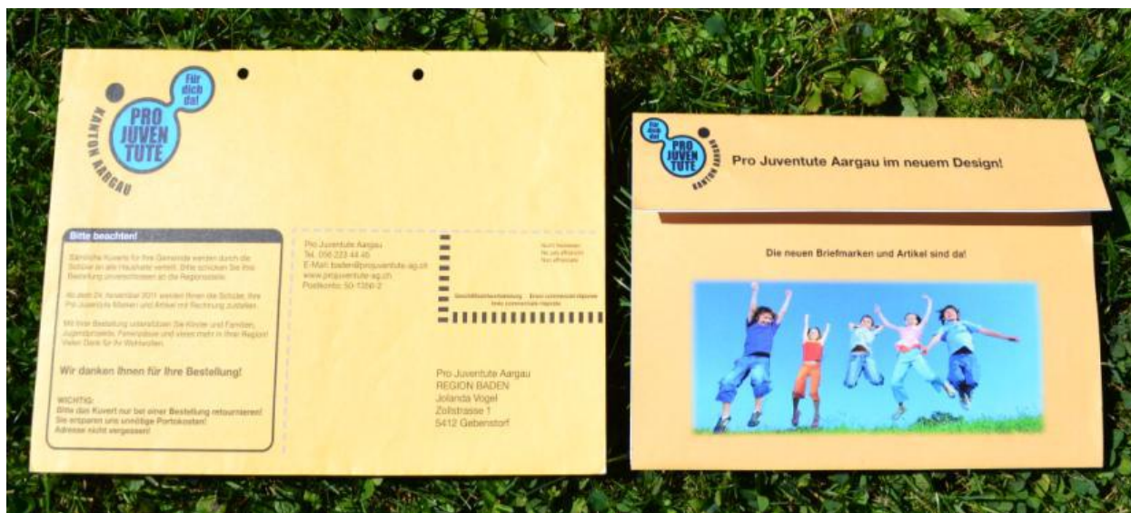
Pro Juventute Aargau

Nur mit dem Aargauer Flyer unterstützen Sie direkt Kinder und Jugendliche der Region Zurzach! Herzlichen Dank für Ihre Unterstützung zu Gunsten unserer Kinder!