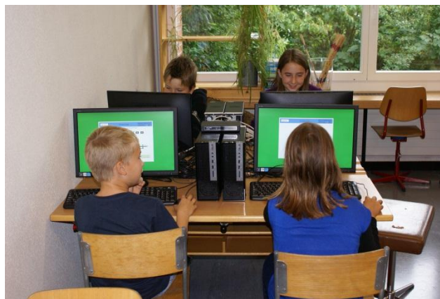
in der 3./4. Klasse beim Rechnen

Die Schule bedankt sich beim Gemeinderat und der Bevölkerung für die Zustimmung des Projektes.